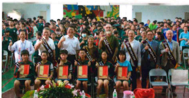
用閱讀激勵生命—永續送書香下鄉讀書希望系列公益活動。