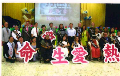
2018年全球熱愛生命獎章得主會師活動。