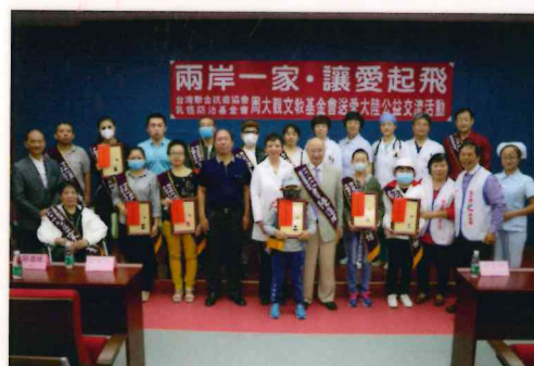
兩岸一家·讓愛起飛—周大觀文教基金會送愛大陸公益交流活動。