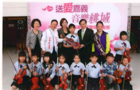
送愛嘉義—捐贈二手樂器再奏希望樂章。