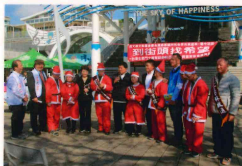
到街頭找希望—台灣生命鬥士為幫助敘利亞難童、貝里斯盲童義演傳愛（台中清水服務區）。